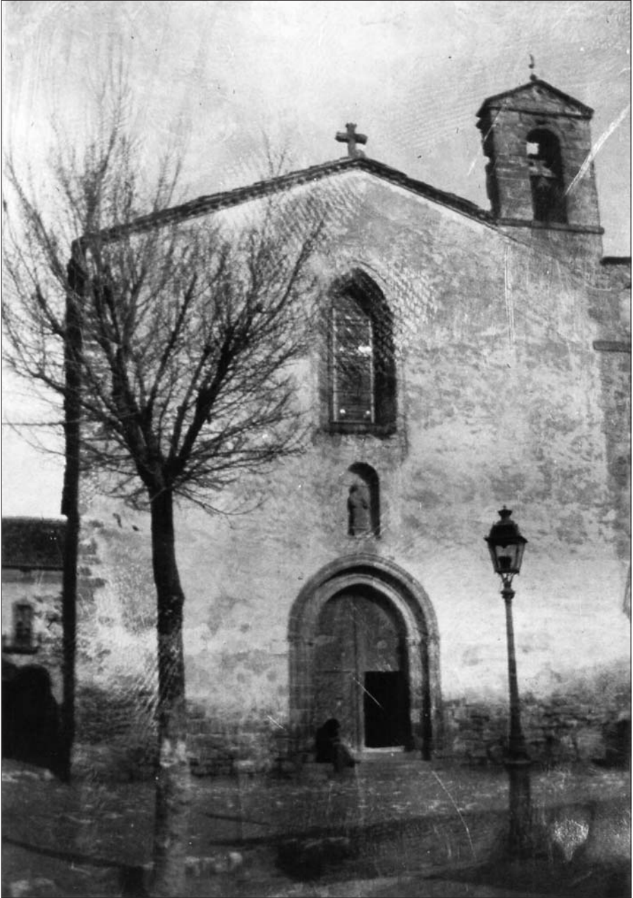
Façana de l'església de Sant Francesc de Paula.