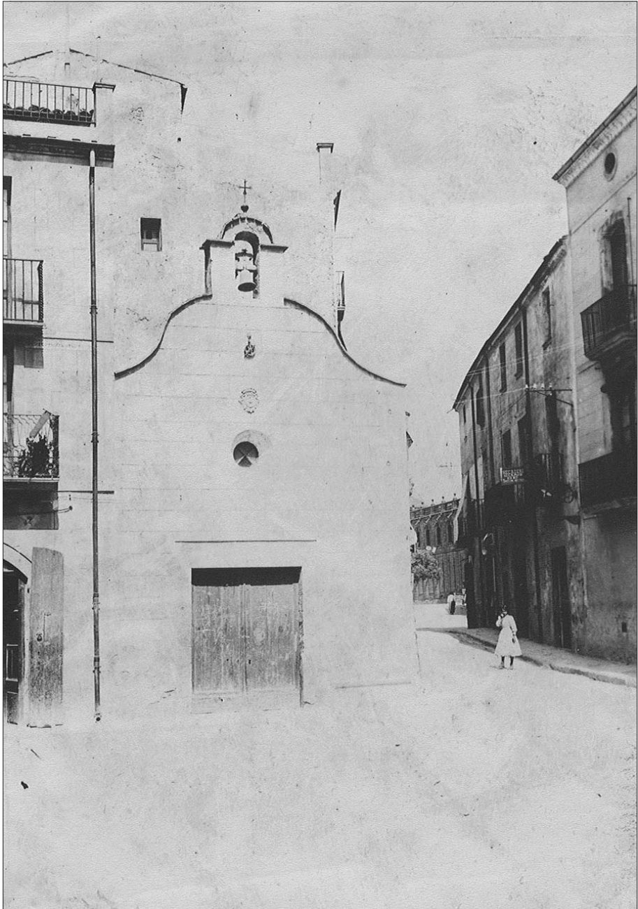
Façana de l'església de Santa Anna.