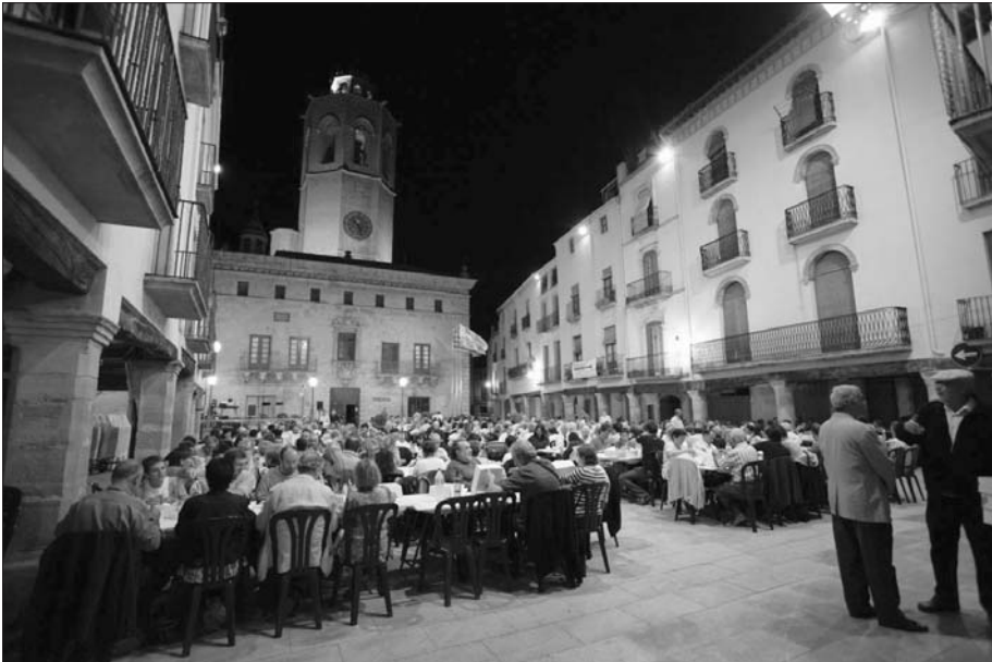
Sopar de Sant Magí.

Solament s'han venut 15 botelles del cava etiquetades per a l'ocasió. Com l'any passat les teníem en refresc a cal Porredon, a les neveres que ens va deixar Carbonell Vins i Licors.