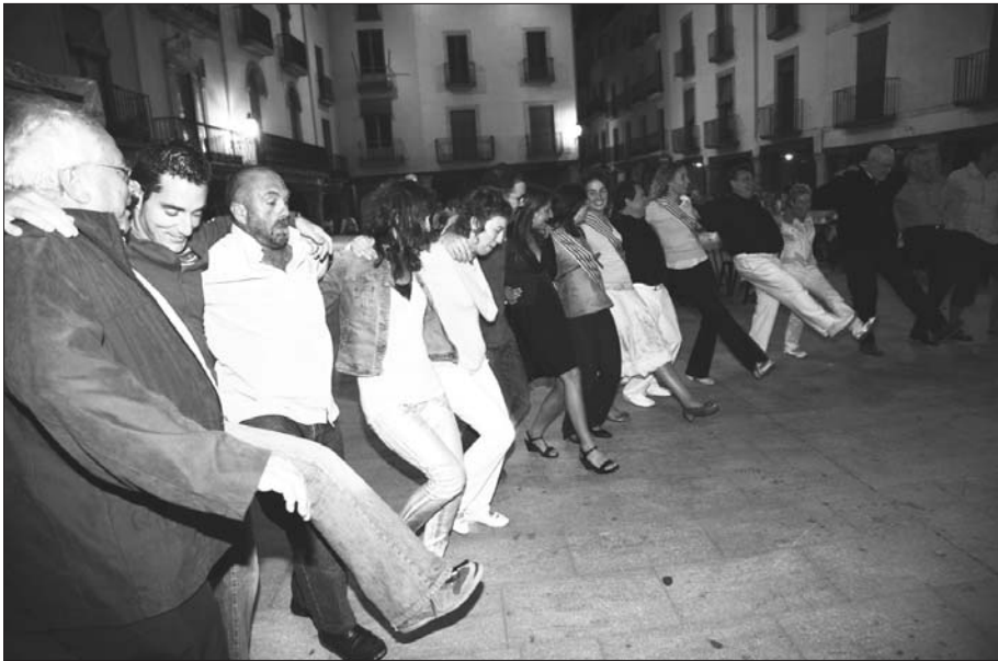
Ball de la coca.

Tot plegat va néixer el passat 18 de maig (festa de Sant Felix de Cantalicio –havia tingut altar a la capella de Sant Magí–), durant la celebració del "8è Aniversari de la reconstrucció de la Capelleta de Sant Magí". Tot esmorzant, algú va demanar als components del duo que cantessin i ara aquí en tenim el resultat, la