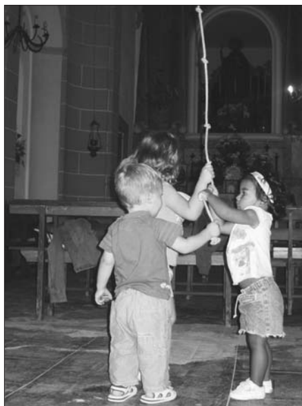
Tocant la campana.