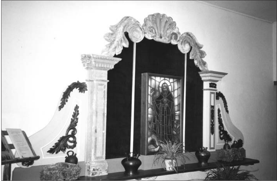
Retaule.