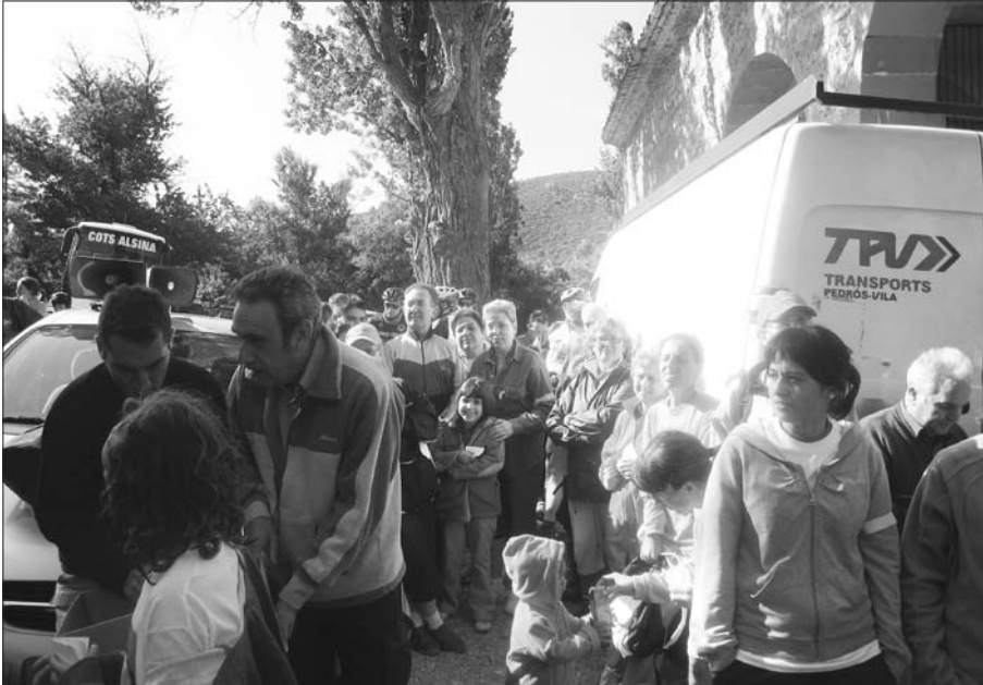
Sorteig.