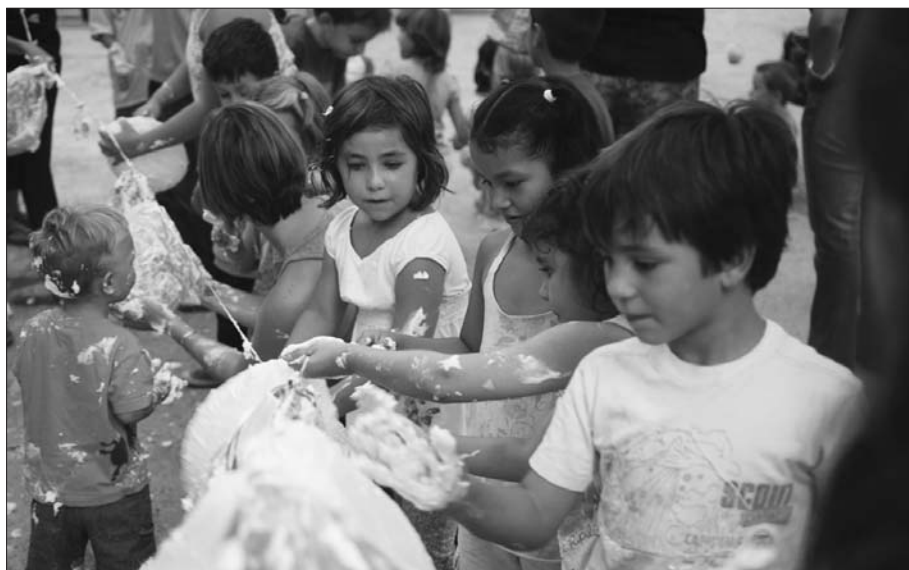
Els còssos.