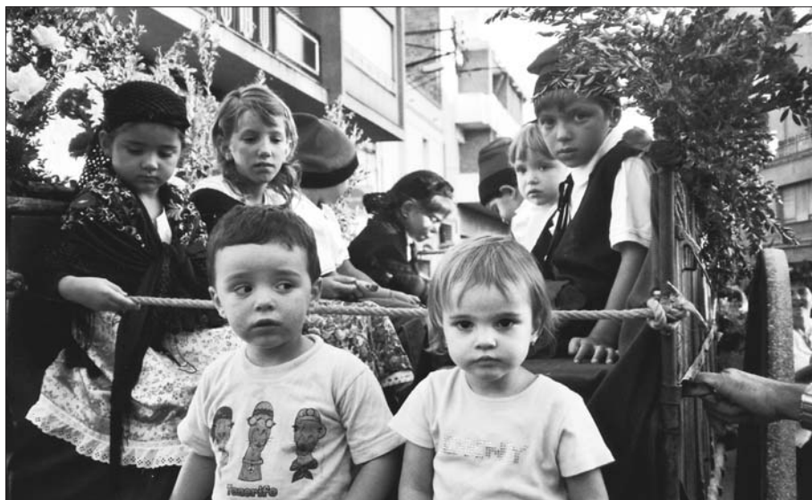
El carro.

En arribar a la Placeta de l'Estació, els portant hem estat obsequiats per part de l'Associació amb: una mida del Sant per posar al bridó, la samarreta que es va donar de record de la XVII Marxa a la Brufaganya , una botella de cava, una capsa de galetes i un número pel sorteig d'un pernill A la llista hi cal afegir els dos tiquets per l'esmorzar de la Brufaganya i pel sopar de Sant Magí a la plaça Major.