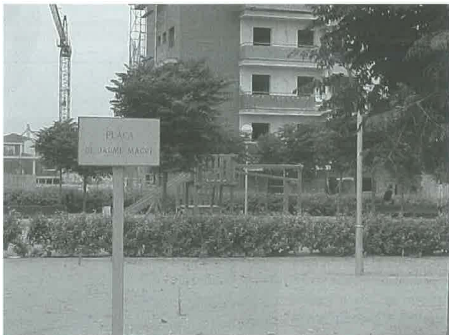
Plaça de Jaume Magre a l'Urbanització de l'Antic Camí de Castellnou.

Ben segur que Jaume Magre se sentiria molt agraït de la plaça que Cervera li ha dedicat en la zona urbanitzada del PP1, quasi al final de l'avinguda Francesc Macià, entre l'avinguda de la Segarra, cantonada amb Francesc Macià, on s'hi troben també la plaça del Parlament, el carrer del President Irla, el carrer Josep Benet i el carrer de l'Alcalde Ramon Balcells.