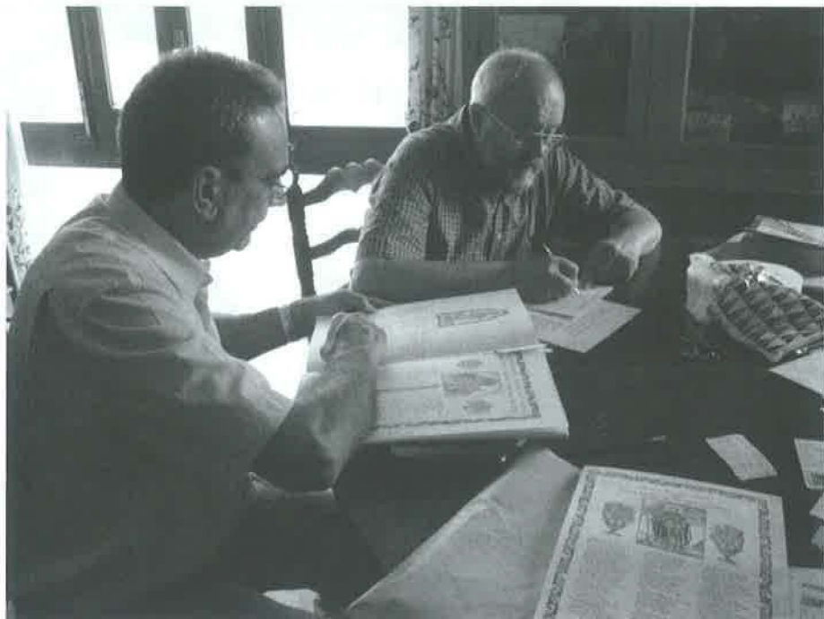
Ulldemolins. 4-7-07.

també n'hi ha de destinades a Barcelona, Vilafranca i Madrid(!). El text generalitzat és el clàssic i ancestral conegut arreu del país: