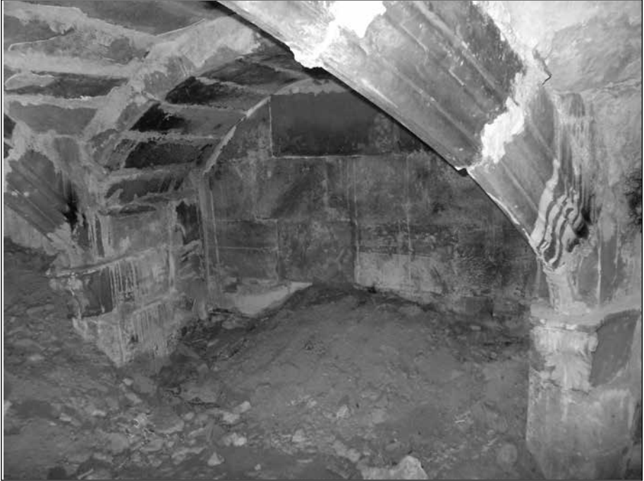
Vista de la Cripta, plena de runa.

Cervera se li aparegué el fundador de l'Orde. A més, com a ningú dels amics de Sant Magí se li escapa a aquestes alçades, fou precisament també per la influència dels dominics que anem anualment a la Brufaganya a buscar l'aigua miraculosa de l'anacoreta que després es reparteix per la ciutat.