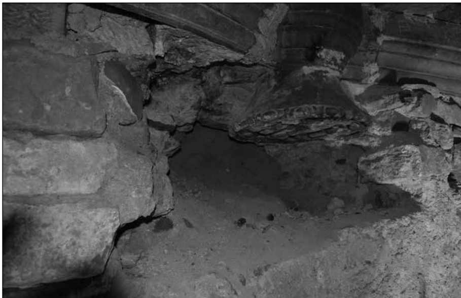
Vista de la Cripta, plena de runa.