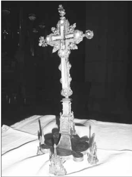
Reliquiari amb la Santa Espina.

a aquesta data, i tenint ja últimament només funcions de magatzem.