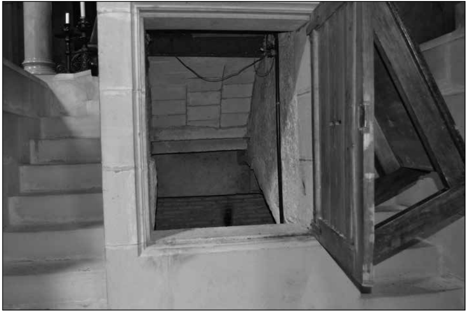
Porta actual d'entrada a la Cripta.