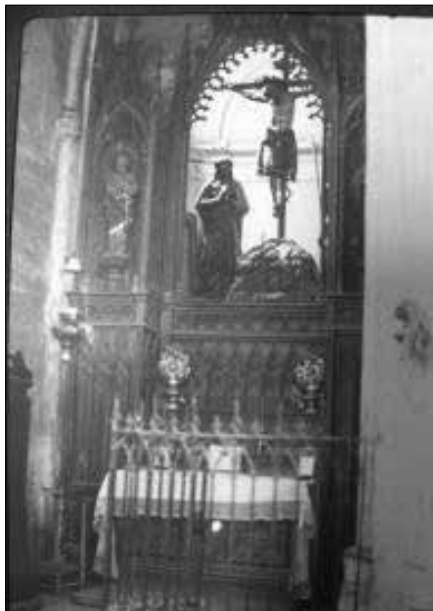
Templet amb el Sant Crist de la Sang.

Encara que a Cervera aquest element de la Passió ha estat eclipsat per la Vera Creu, i el miracle del Santíssim Misteri, no