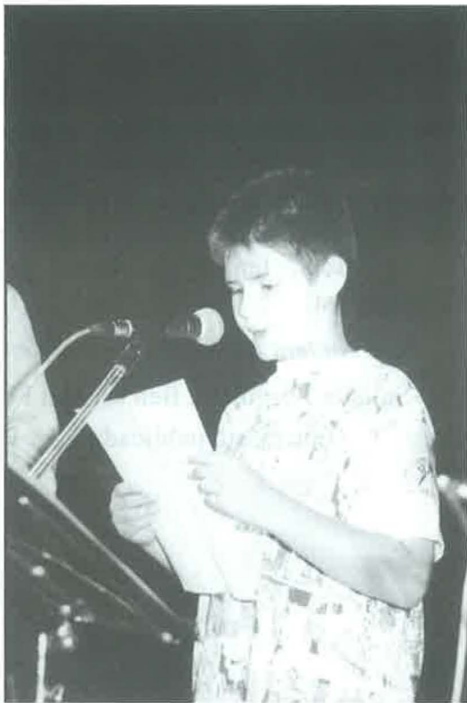
El nét Narcís llegint unes ratlles agràides de l'avi.

-S'hi va enganxant. Evidentment, però, la festa de Sant Magí és l'anti-Aquelarre, no es poden pas comparar. Sí que et puc dir que, així com altres festes de barri s'han anat apagant fins a morir, Sant Magí ha anat creixent, i moltes coses estan millor ara que no pas abans. És més bonica la vigília, el dia 18, que no pas el dia de la festa en si, el dia 19. Crec que aquest dia ha perdut una mica de pes dins de la celebració general. El repartiment de l'aigua pels carrers, per exemple, és un acte que queda una mica esbravat, perquè a Cervera hi ha massa distàncies.