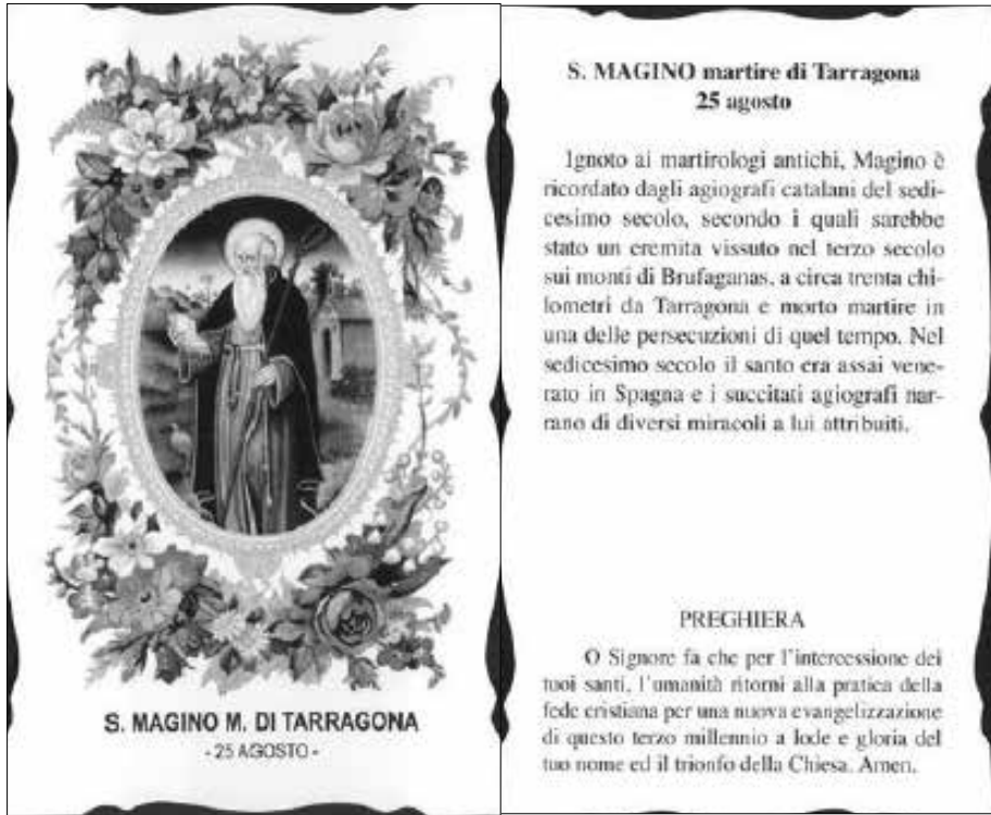
Imatge 1 i 2.