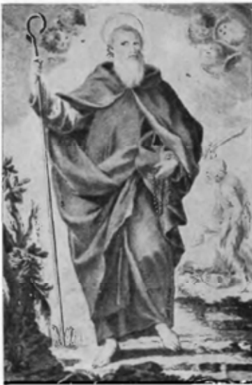
MAGINO di Tarragona. Immagine di M. Incisione, Barcellona, Archivio Storico (sec. XVIII).