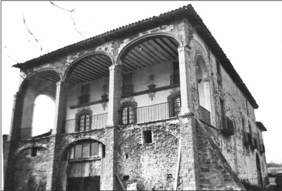
Mas la Vila de Llaés (1). Autor: Moreno, J.M. / Puig i Castells, Antoni. Pàgina web: http://calaix.gencat.cat/handle/10687/85350 [consulta juny 2021].

les imatges de Sant Ramon de Penyafort i Sant Magí i pintar entorn de Sant Hilari els quatre doctors de l'església llatina: Sant Agustí, Sant Ambrós, Sant Jeroni i Sant Gregori." Hi ha la nota de peu de pàgina amb aquest text: "(51) Arx. Par. Vidrà, Man. 1 del rector Ferreras, fol. 31."