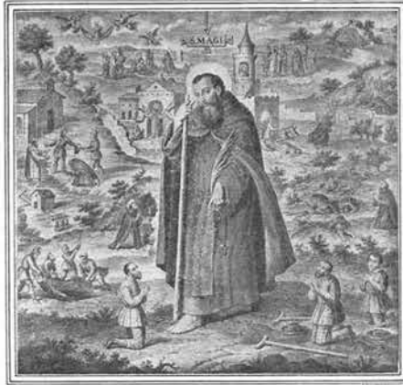
SAN MAGIN ERMITAÑO Y MARTIR.

MAS VILA de la ST. BARTOMEU BISBAT LA SEVA FESTA