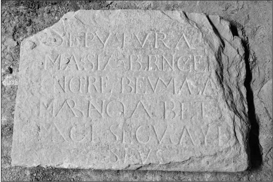
Làpida de la tomba multi-familiar.

La làpida està solta i fora del seu lloc i es nota que ha estat entre enderrocs. Està deteriorada tot i que la inscripció es veu sencera.