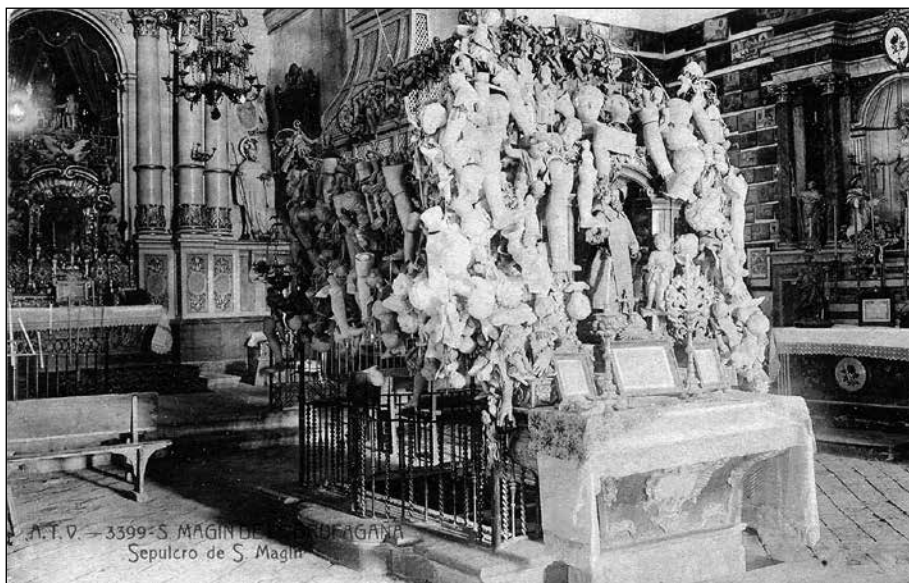
Sepulcre de Sant Magí. Postal d'Àngel Todrà Viazo.