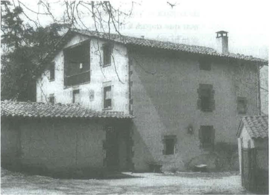
Masia Torrens, a Tavèrnoles.

guanyats pels cabalers, van ajudar a “aixecar” alguna hipoteca que gravava en la casa pairal o a pagar una mula o animal de treball. Una altra sortida va ser el ram de la construcció, sobretot després de la II Guerra Mundial a Alemanya on molts van anar a buscar feina, i d’altres van fer cap a la capital per aprendre un ofici. Alguns d’aquests cabalers, sense que ells s’ho poguessin arribar a imaginar mai, han esdevingut grans personatges de la nostra cultura i la nostra societat civil.