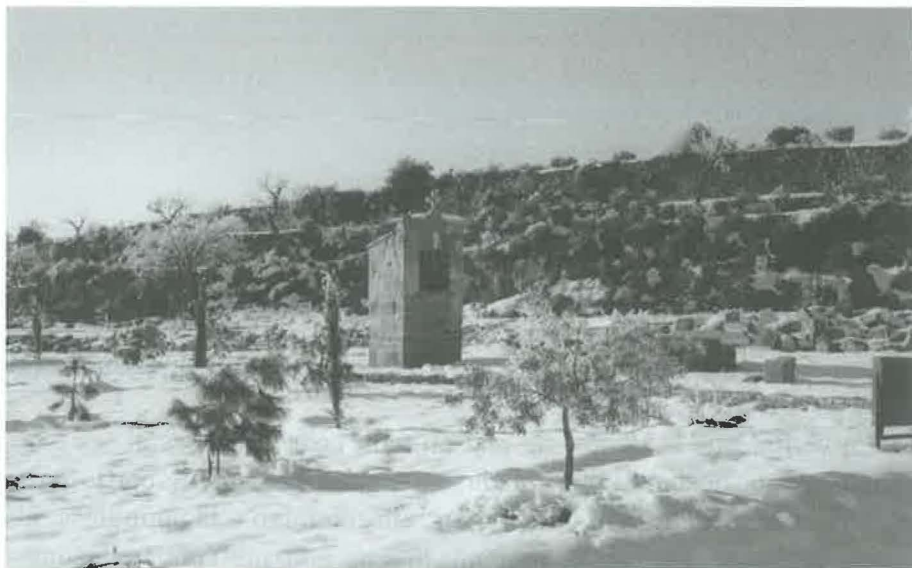
La capelleta en les mateixes circumstàncies.

la major part dels arbres i plantes que durant aquests últims anys s'han plantat a l'entorn de la capella de Sant Magí. Les oliveres molt petites i amb poques defenses varen quedar totalment seques. Ara sembla que amb l'abundància d'aigua de la primavera, algunes rellucaran, igualment les alzines i alguns pins, però, hem observat que l'arbre que ha resistit molt bé les inclemències del temps ha estat la Servera, esvelta, exuberant, lenta en el creixement, però segura: és la reina de l'entorn.