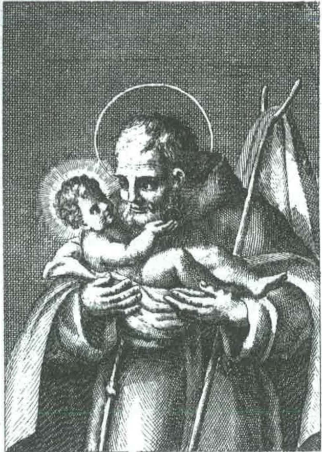
S. FELIX A CANTALICIO Confessor Ord. Min. Capuocín: obít. an. 1585.

- Goigs a llaor de Sant Feliu de Cantalici. Patró dels germans llecs de l'Ordre de Frares Menors Caputxins, la imatge del qual es venera en l'església de Caputxins de Sarrià (Barcelona). L'Església celebra la seva festa el dia 18 de Maig. Imp. Corominas.- Solsona.