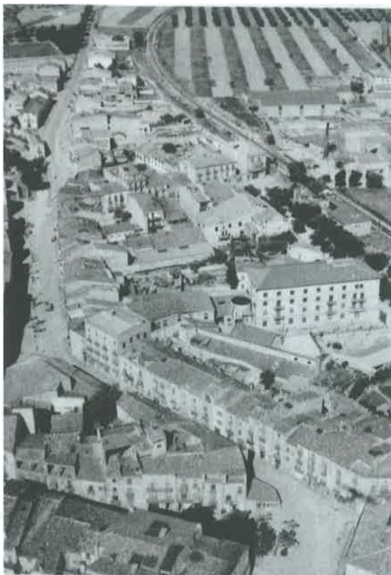
Arrabal de Capuchinos CERVERA (Lérida)

davant de la capella i llavors van decidir que la penjarien de la volta del temple, com a testimoni d'aquest fet per a futures generacions. Però també es parla que en el moment del seu descobriment reflectia una llum tan viva que els propis obrers van començar a cridar " Miracle!, Miracle! "; encara que una tercera versió esmenta que va ser la devoció amb què era venerada i que portava els fidels a demanar-li el seu auxili en tots els moments de dificultats i que, com que mai els fallava, eren tants els miracles aconseguits per la seva intercessió, que tots la coneixien per aquest nom; però hi ha encara un altra interpretació segons