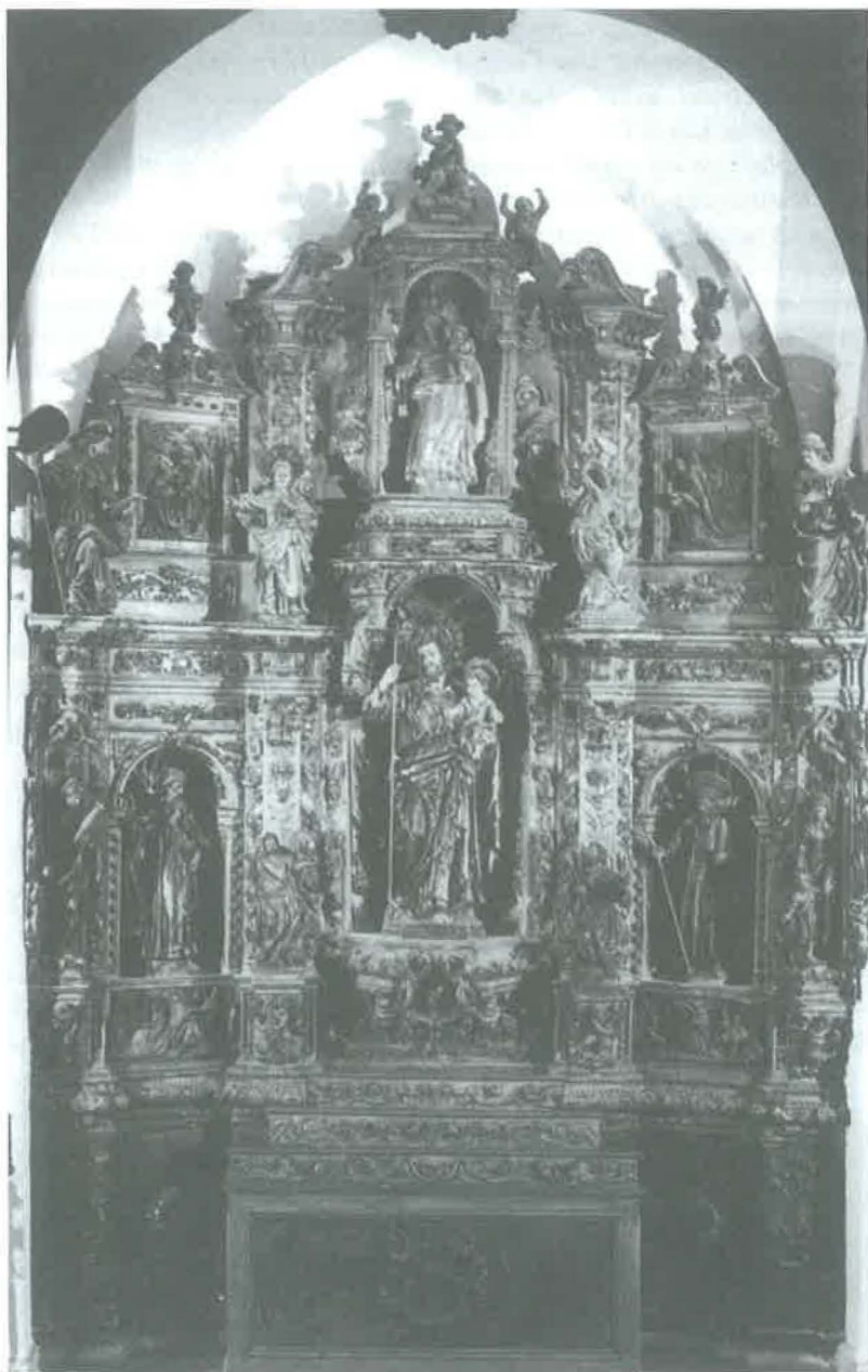
El retaule de la Verge del Remei avui. (Fotografia del llibre Els retaules barrocs i l'orgue de l'església parroquial de Sitges , Isabel Coll i Mirabent. Grup d'Estudis Sitgetans i la Parròquia de Sant Bartomeu i Santa Tecla de Sitges. 1993).