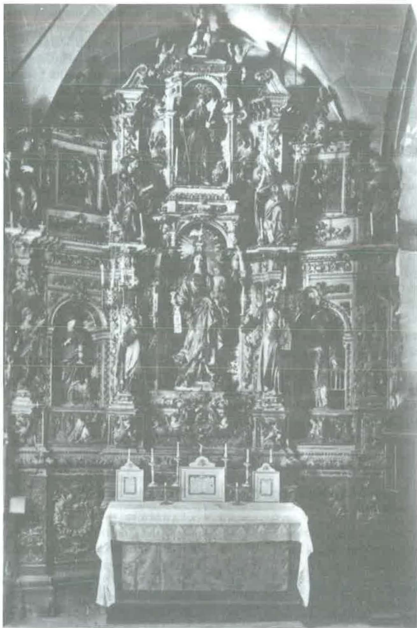
El retaule de la Verge del Remei abans de 1936. (Fotografia del llibre Els retaules barrocs i l'orgue de l'església parroquial de Sitges , Isabel Coll i Mirabent. Grup d'Estudis Sitgetans i la Parròquia de Sant Bartomeu i Santa Tecla de Sitges, 1993).