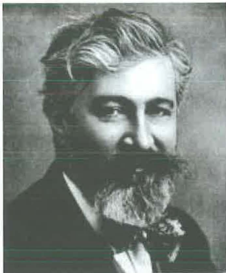
Santiago Rusiñol i Prats (1861-1931)

trobar a la persona que ens poguéis donar més dades d'aquest, i torno a repetir l'adjectiu, magnífic quadre.