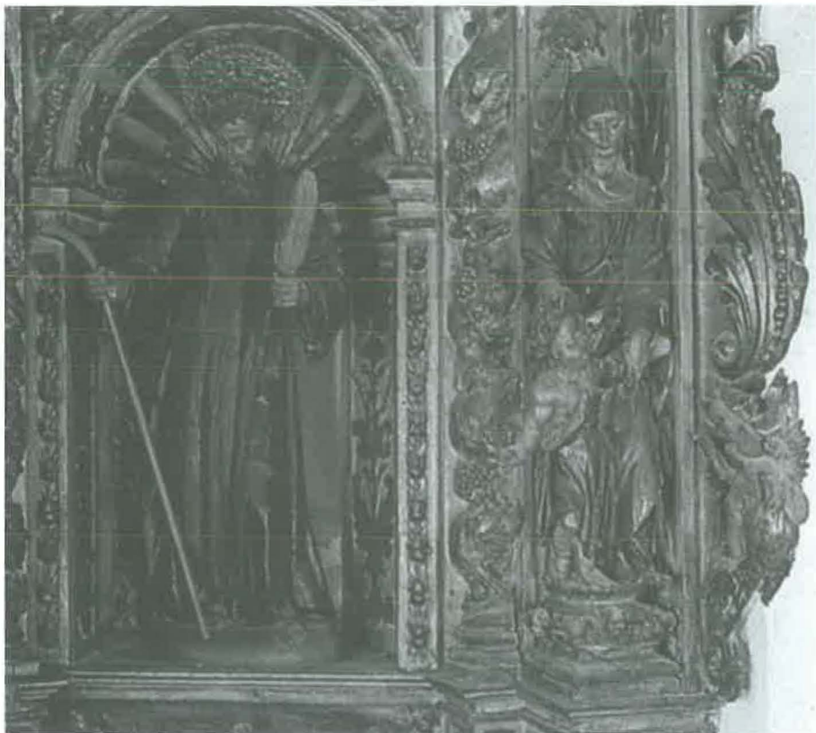
Sant Magí, Santa Elisabeth i Sant Joan.

Ceràmica esmaltada i pintada. Pasta color beige. Elaboració a motlle. Vidriat blanc lletós. Decoració en policromia a base de marró, verd, blau, groc i morat.