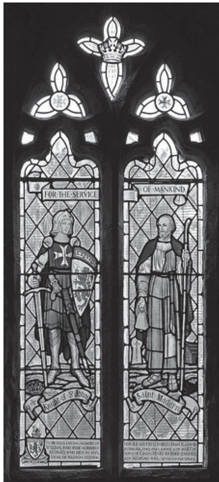
Vitrall de Saint Madern