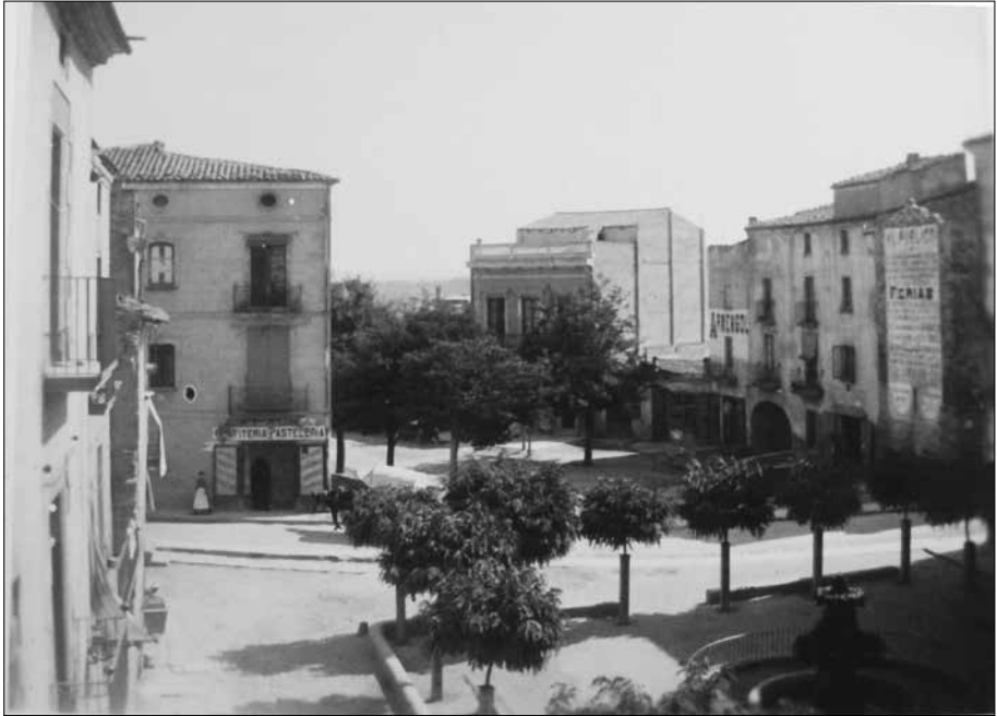
La plaça l'any 1920 amb el brollador i la font al mig.

els nous propietaris l'havien cedit per a instal·lar-hi la Tómbola Benèfica que ja en aquells temps per la Festa Major de setembre la gent de Cervera organitzava per ajudar els més necessitats. Estaríem en torn als primers anys 50.