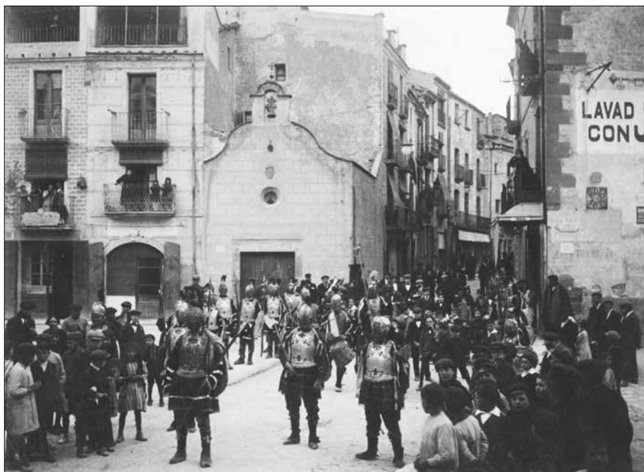
La campana Santa Anna va estar del 1827 al 1936 a la seva capella de la plaça del seu nom.

encara avui penja sota el ràfec de la Casa de la Ciutat, davant el portal de l'església de Santa Maria. I l'any 1701, amb la vinguda de Felip de Borbó, es guarní la plaça de manera molt ostentosa per celebrar-ho.