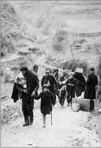
Apareguda a L'Il·lustration del 18 de febrer de 1939 (La Retirada a Prats de Molló)

Les Normes de l'Institut responen, doncs, a una necessitat àmpliament compartida i troben en les institucions públiques i privades el suport necessari. Ara bé, l'èxit és la conseqüència directa dels criteris moderns i coherents aplicats per Pompeu Fabra, l'artífex indiscutible de la normativització del català. Fabra té una preparació lingüística molt superior a la dels seus predecessors que li permet fixar l'ortografia de la llengua mitjançant un estudi previ, rigorós i exhaustiu del funcionament global del sistema fònic que té en compte el conjunt de l'àrea lingüística catalana. La coherència de les Normes , el posterior Diccionari ortogràfic de 1917 i la Gramàtica catalana de 1918, junt amb la difusió que en fan les institucions i la tasca divulgativa