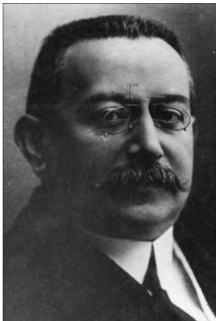
Enric Prat de la Riba.

En el seu primer discurs com a president, Prat anuncia que l'objectiu prioritari de la Mancomunitat és dotar tots els municipis d'escola, de biblioteca, de telèfon i de carretera. I cal tenir present que, a l'any 1914, molts pobles de Catalunya no tenen cap d'aquests elements. De fet, la Mancomunitat és més que un òrgan administratiu, per a Prat, perquè la seva intenció consisteix a crear una entitat política que posi les bases d'una futura autonomia de llarg abast. Per a aconseguir-ho, funda i envigoreix institucions com l'Institut d'Estudis Catalans, la Biblioteca de Catalunya, les Biblioteques Populars, l'Escola Superior d'Agricultura, l'Escola del Treball, la Universitat Industrial, l'Institut d'Educació General, l'Escola d'Estiu, la de Funcionaris de l'Administració Local, la de Bibliotecàries, la de Bells Oficis, la d'Infermeres, la Junta de Museus, la Caixa de Crèdit Comunal, l'Oficina d'Estudis Jurídics i més. Totes