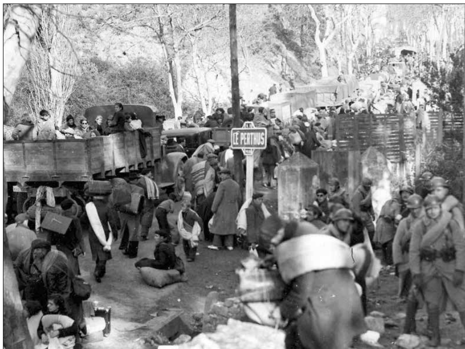
Pas fronterer del Portús.

llengua parlada del moment. Són dues posicions difícilment compatibles que evidencien encara més el divorci existent entre llengua parlada i llengua escrita. Els intel·lectuals més conscients constaten la urgència d'una normativa ortogràfica unificada, coherent i moderna, que depuri i enriqueixi el vocabulari i la gramàtica, perquè sense aquest requisit no es pot implantar a les escoles ni aspirar als usos oficials i, per tant, continuaria en condicions d'inferioritat aclaparadora en relació a la llengua castellana força omnipresent. És evident que el català no pot assolir un ús normal si no disposa d'unes normes precises i clares; és a dir, la normativització és l'etapa prèvia a la normalització de la llengua.