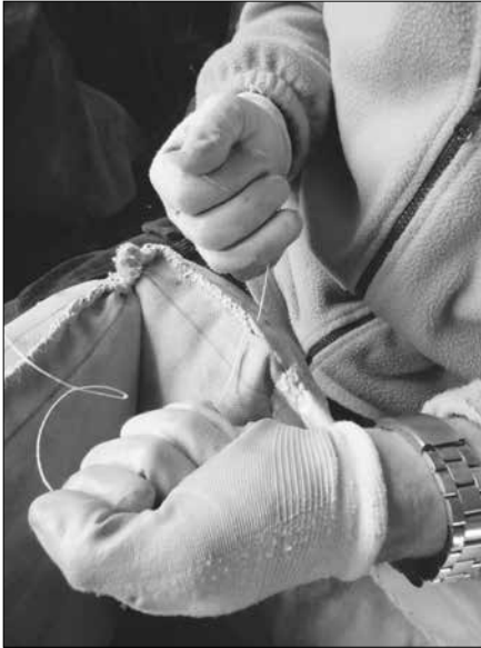
Cosint albardes.