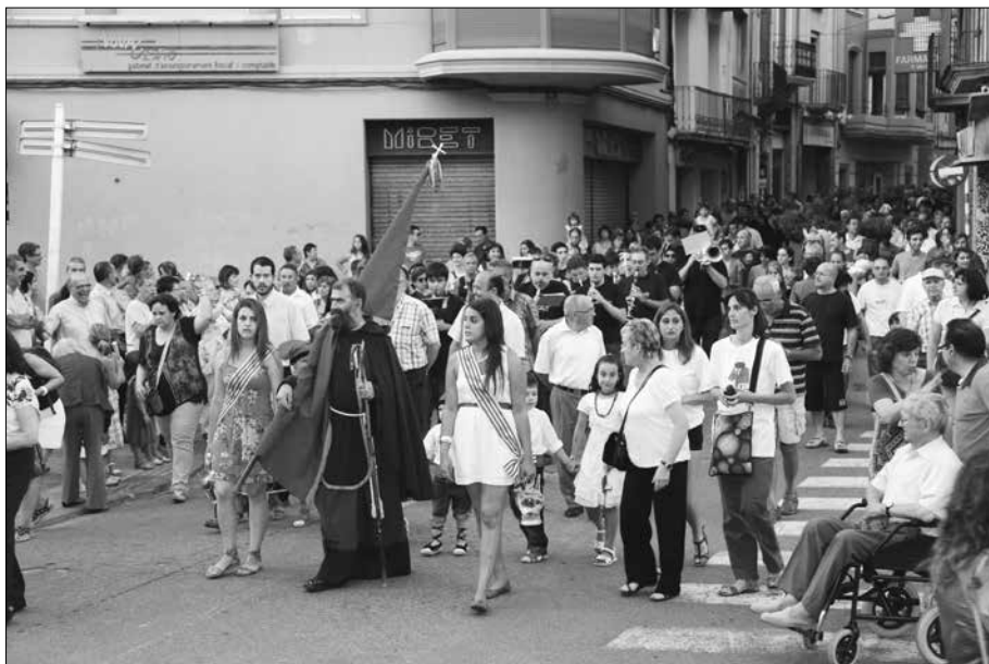
Passant per la plaça Santa Anna.