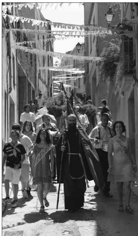
Arribant a la Capella.