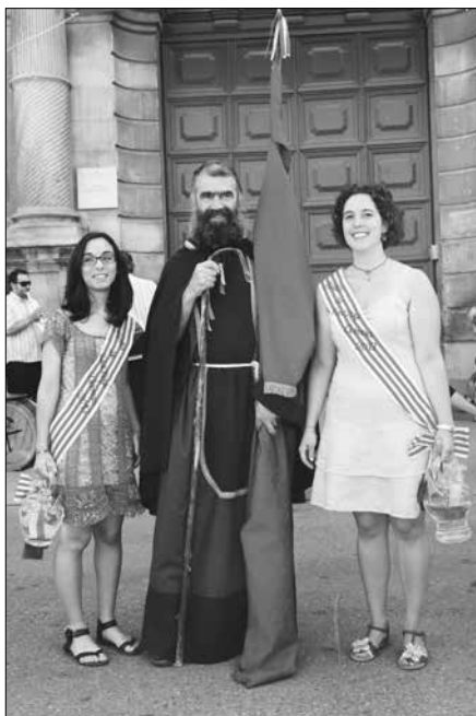
Davant de la Universitat.

galletes “Maginet” i moscatell, davant de casa seva, al carrer Pou Nou.