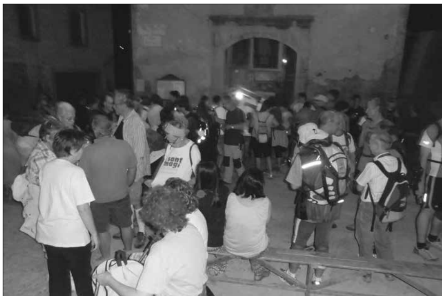
Preparant la sortida de la XXII Marxa a la Brufaganya.