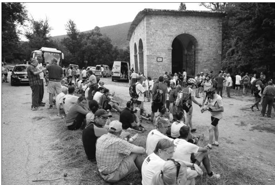
Descansant a l'esplanada de la Capella de les Fonts.