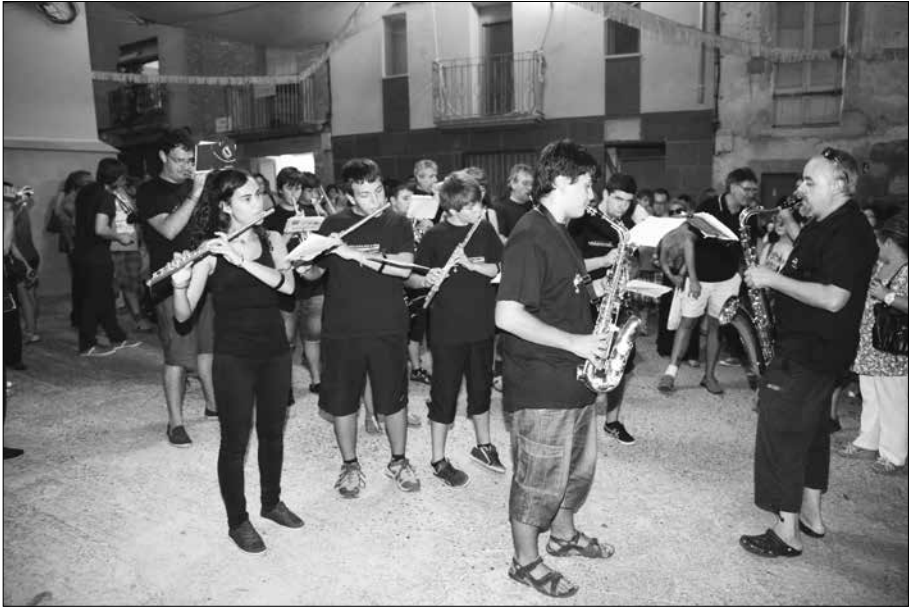
Grup de vent del Conservatori de Música de Cervera a la Placeta de Sant Magí.

la comitiva hi va participar un carro petit, un carret per ruquet. L'hem adornat amb boix i flors de paper, l'hi hem adaptat unes fustes per poder dur 4 càntirs grans. El Pau i jo, un a cada costat, vetllàvem que les rodes no fessin mal a ningú. Un any més els portants han estat obsequiats per part de l'Associació amb: una mida del Sant per posar al bridó, una botella del cava amb etiqueta de la Festa, una capsa de galetes i un número pel sorteig d'un pernil. A la llista hi cal afegir el tiquet per l'esmorzar de la Brufaganya i un altre pel sopar de Sant Magí a la plaça Major.