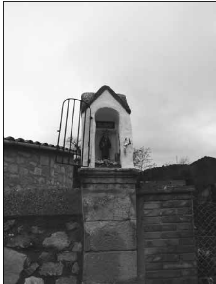
Pedró de Copons.

El diumenge dia 27 d'abril es va celebrar a l'aplec de l'ermita de Sant Magí