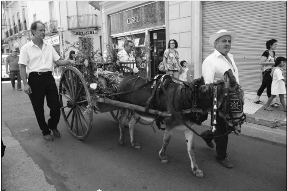
El carret.