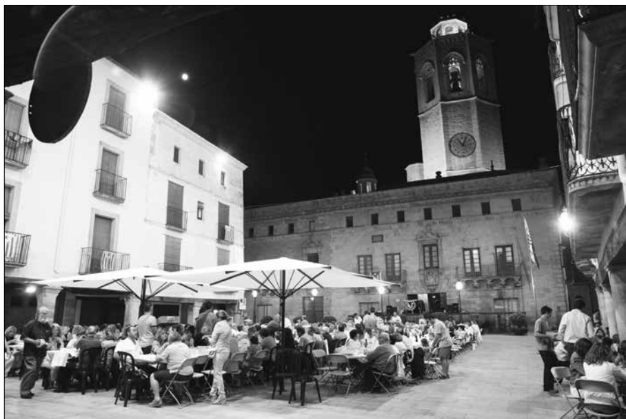
Sopar a la plaça Major.

numerades. A la plaça hi ha una concessió que n'ocupa una part, al parlar amb la Pastisseria Colom que és qui té la concessió, ens va dir que per part seva cap tipus de problema per cedir l'espai per la Festa. Per no haver de desmuntar massa coses es va optar per fer taules lineals, perpendiculars a la Paeria, d'aquesta manera tothom queda amb més bona visió de l'escenari.