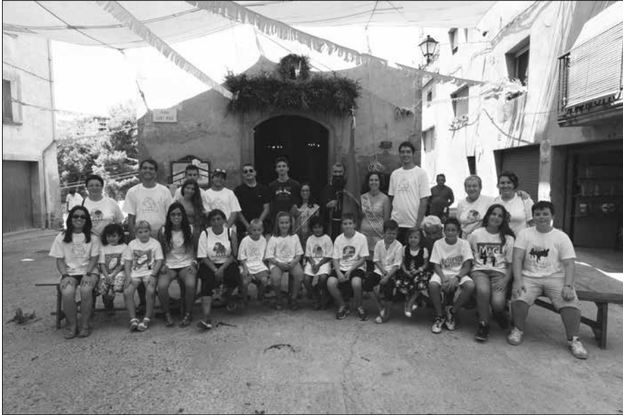
Repartidors de l'any 2013.