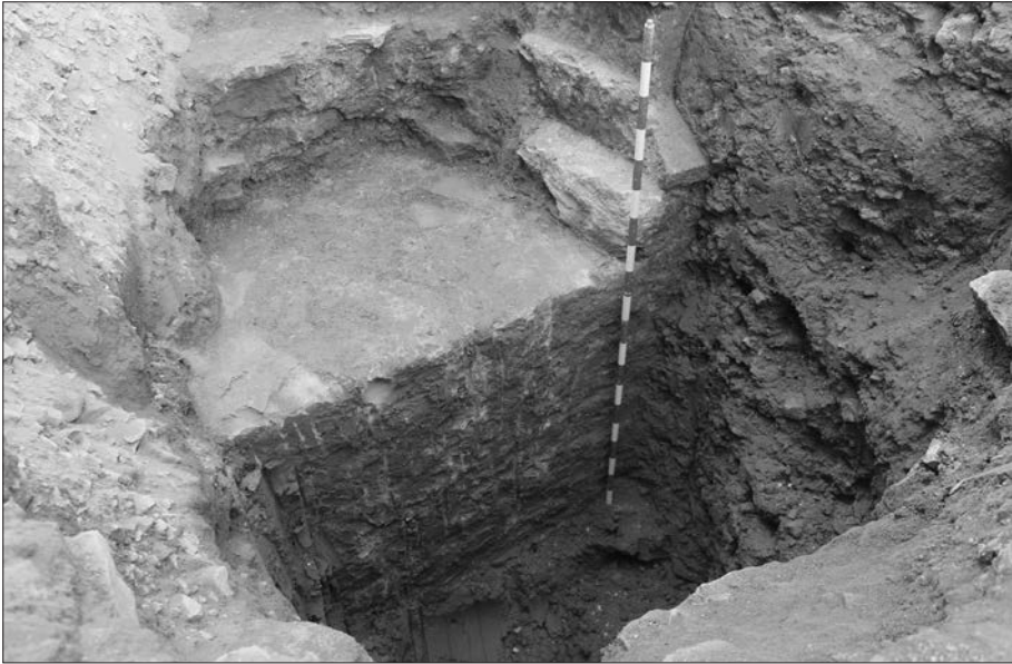
(Fig. 4). Mur i rebaixa del fossat davant el Portal de la Vall.

pedra ben escairada lligada amb morter de calç, entre les quals es tirava un rebliment de terra i runa.