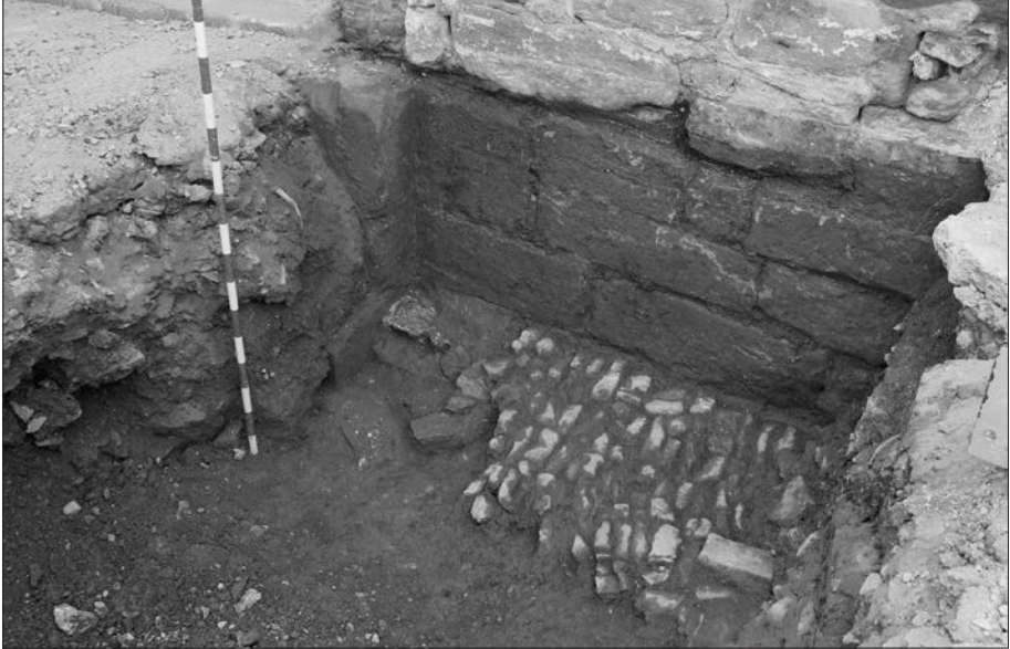
(Fig. 2). Paviment empedrat documentat al Portal de la Vall.

des del castell per la vessant est del turó de Montserè. 1