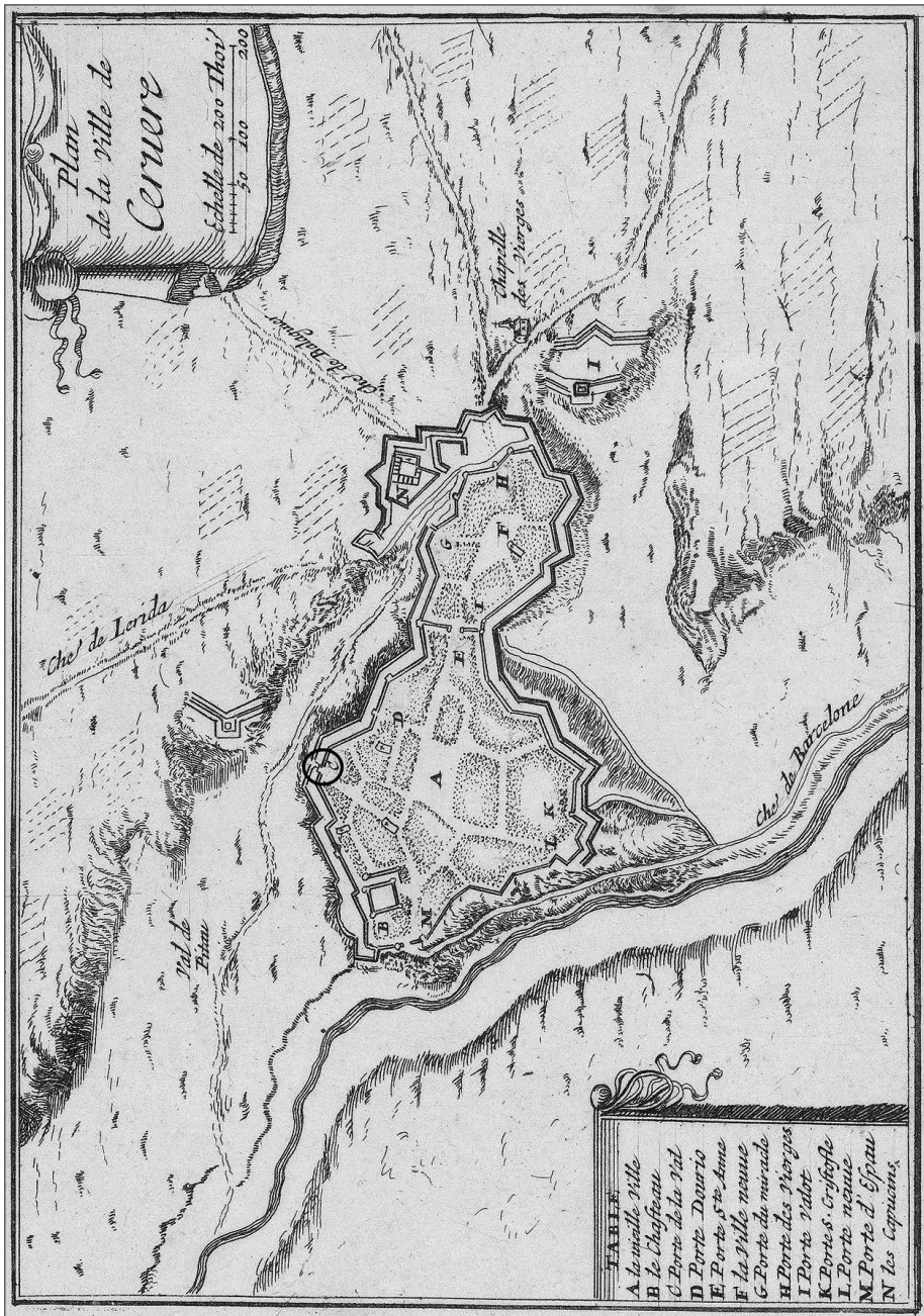
(Fig. 1). Plànol de Cervera elaborat pel militar francès Beaulieu l'any 1659.