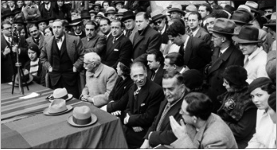
Aurora Bertrana asseguda entre Francesc Macià i Lluís Companys en un míting d'Esquerra Republicana de Catalunya amb motiu de la campanya electoral per a diputats a les Corts (1933).

la presència destacada de la dona en l'àmbit públic, la seva instrucció i el seu paper a fi d'aconseguir una societat més igualitària. Com un exemple d'aquest activisme frenètic, llegim uns fragments de la conferència El nostre feminisme , pronunciada a l'Ateneu Barcelonès, el 15 d'octubre de 1931: