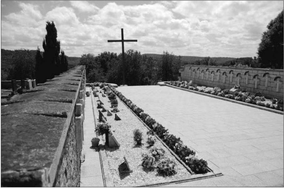
El cementiri dels afusellats: un espai dedicat a la memòria.

alta, i acabava de donar-li un aspecte de desolació i melangia... Al peu d'aquella esglésiola, un ramadet de cases; però quines cases, Déu meu! Mig caigudes, amb els horts i els corrals devastats, les tàpies amb grossos esvorancs; pels carrers, munts de runa dificultaven el pas –i l'herba, sempre l'herba, que a indrets ens arribava gairebé a la cintura. Només un testimoni de vida i d'alegria: la font pública, que seguia desgranant el seu rosari i omplia l'abeurador dels animals i un gran safareig públic, on s'emmirallava un desmai (Entre dos silencis, p. 8-9). A uns vint minuts de camí, aigües avall del poble, s'alçava un cementiri nou, improvisat, que les dones anomenaven cementiri d'afusellats. Allí reposaven els homes del poble i l'herba en tan pocs mesos havia crescut prodigiosament... Petit cementiri, quiet i atraient, olorós