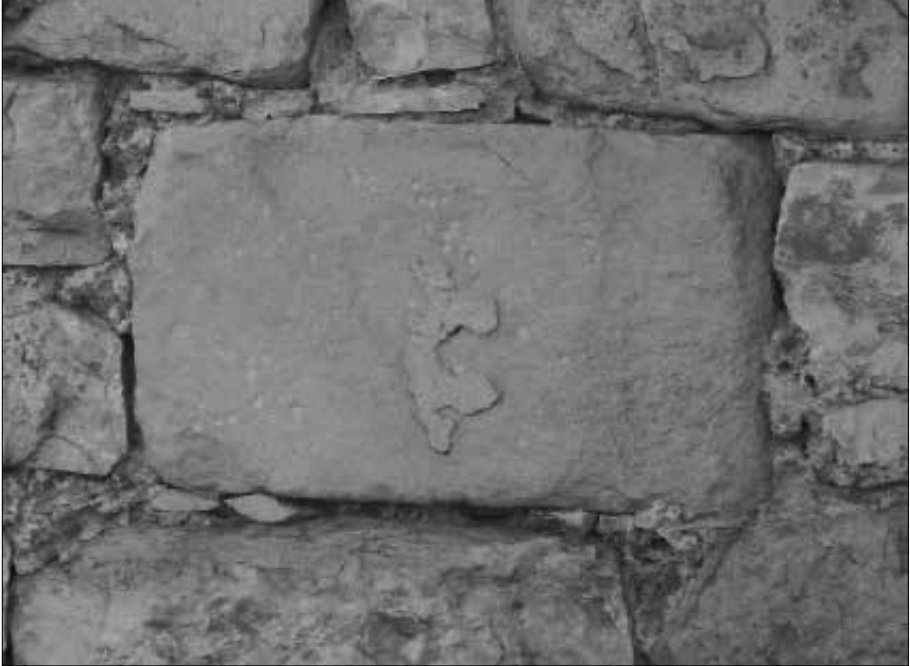
Possible marca de Benet Cassanyé a la façana nord de l'Església Parroquial de Santa Maria de Granyena.

-ACSG, Llibre de Comptes de l'Admi- nistració de Sant Magí, 1837-1882.