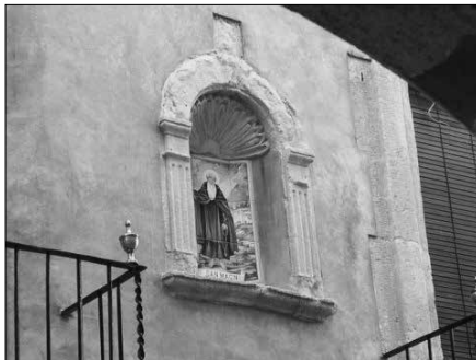
Fornícula de Sant Magí.

Arenys de Mar. - Comarca del Maresme (Barcelona).