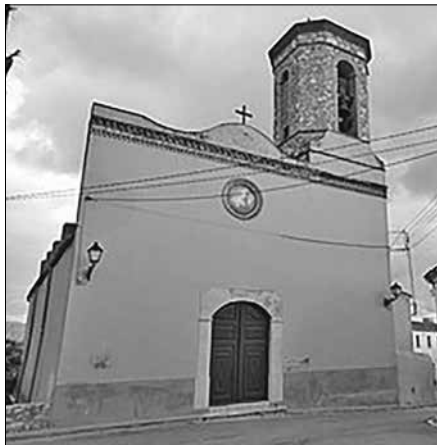
Església del Sagrat Cor (les Peces, Albinyana). [Consulta Wiquipèdia, 03/2023].