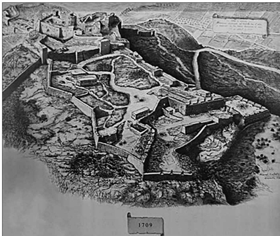
Castell de Santa Bàrbara. [Consulta internet, Cartografia de la ciudad antigua de Alicante , 03/2023].

"Josep Caixal i Estradé (El Vilosell, Garrigues, 9 de juliol 1803 - Roma, 26 d'agost 1879) fou Bisbe d'Urgell i Co-príncep d'Andorra des de 1853 fins a 1879, coincidint amb el període de la Nova Reforma que es dugué a terme al Principat d'Andorra". [Consulta Wiquipèdia, 03/2023].