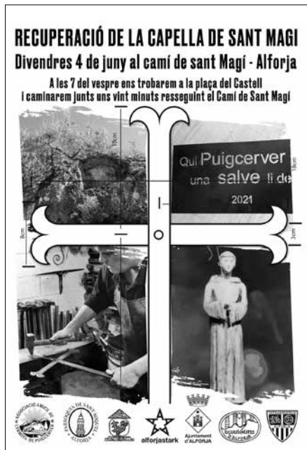
Cartell de la inauguració.

Crec que es podria referir a l'oració Salve Regina o l' Avemaria: Déu vos salve, Maria, plena de gràcia, el Senyor és amb vós, beneïda sou vós entre totes les dones i beneït és el fruit del vostre ventre, Jesús.