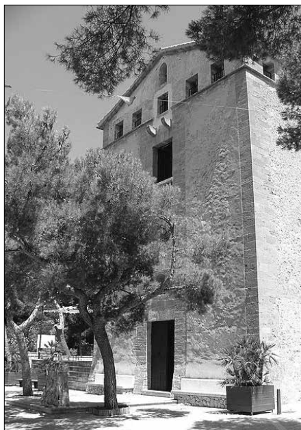
Santuari de la Mare de Déu de la Victòria. Alcúdia.