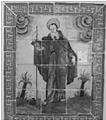
Plafó de Sant Magí del Museu d'Arenys de Mar. [Consulta 03/2023].

Arfa - la Freita.- Municipi de Ribera d'Urgellet, comarca de l'Alt Urgell (Lleida).